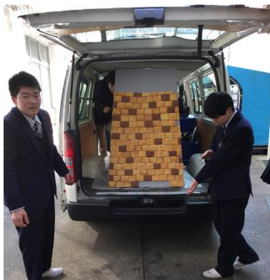
パセオ閉店後の組み立て