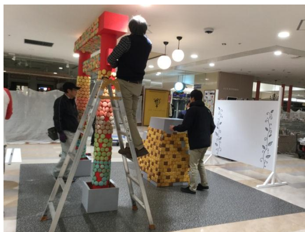
2月1日（月）パセオで最終仕上げ