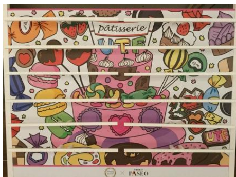
絵馬かけも本校生徒のデザインです。