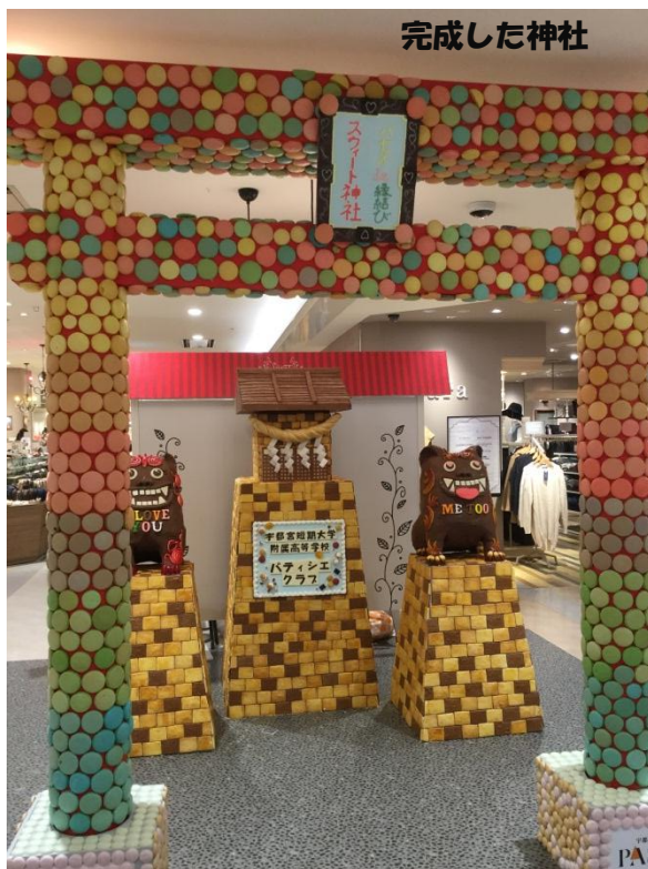
パティシエクラブのメンバー

鳥居は色とりどりのマカロン3,600個、神社にはクッキー5,000枚が あしらわれています。狛犬と神社の屋根はチョコレート、しめ縄はパンです。