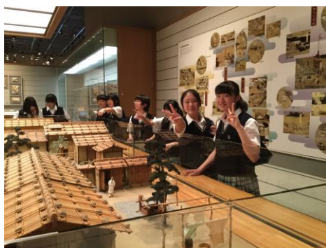
国立民俗歴史博物館