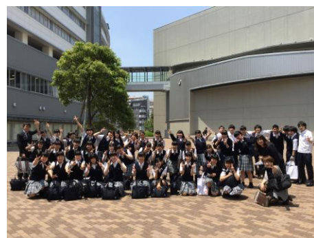
日本大学芸術学部