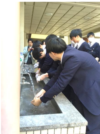
手洗いのやり方を確認