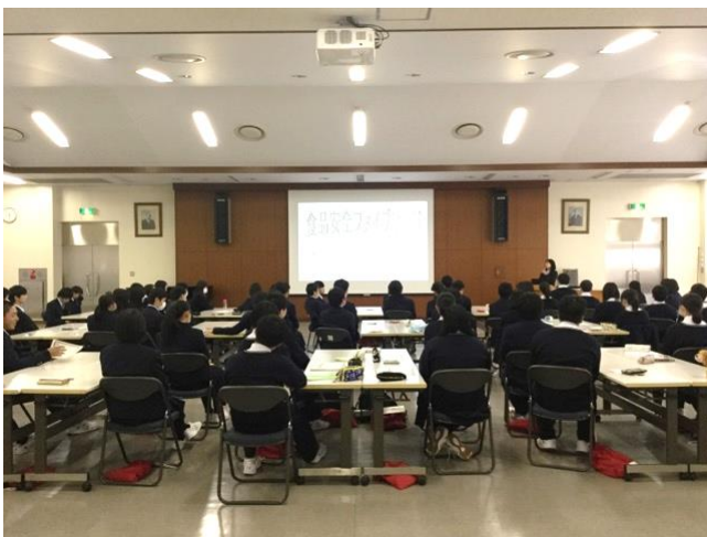
食品安全ファイブリーグスタート！

「食品安全ファイブリーグ」というクイズ形式で、グループごとに話し合いながら講習が進められ、さらには、手洗いチェッカーを使った実験など、生徒たちは有意義に学ぶことができました。細菌を食べ物に「つけない」、食べ物に付着した細菌を「増やさない」、食べ物や調理器具に付着した細菌を「やっつける」という食中毒予防の三原則を基本に、将来、食品衛生の管理を担うプロの調理師となる自覚を高めることができました。