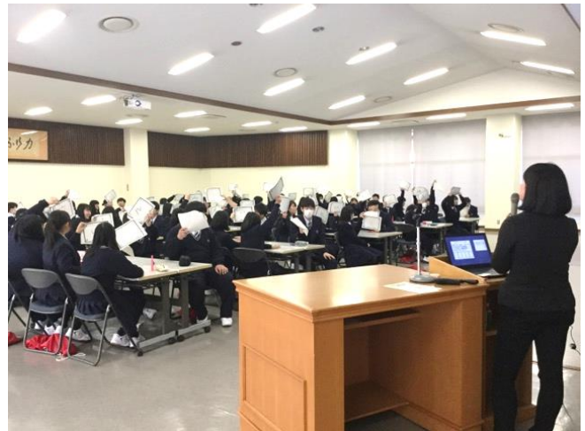
皆で協力しながら答えを出していました