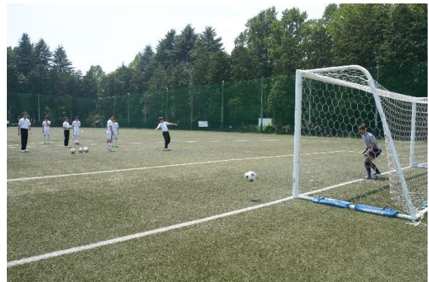
サッカー部 シュート体験