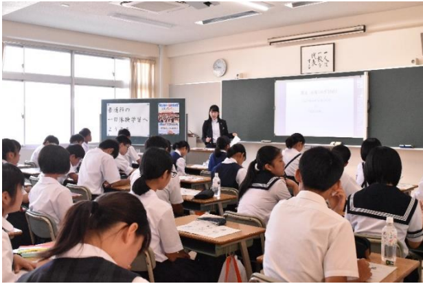
普通科 社会の模擬授業