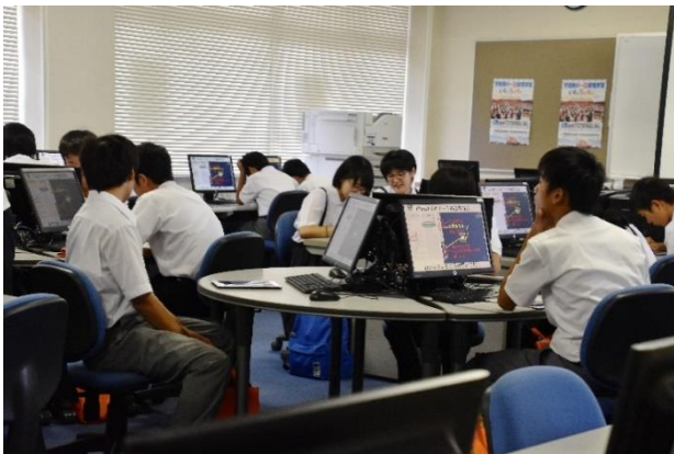
情報商業科 マーケティング模擬授業