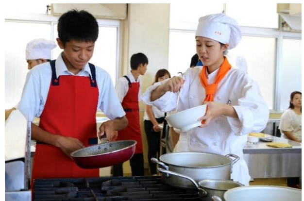
調理科 簡単レシピ体験