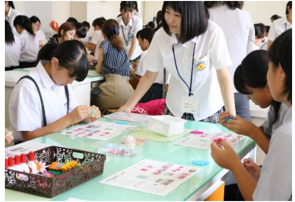
生活教養科 お花のブローチ作成