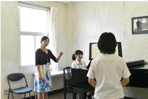
音楽科 実技レッスン見学