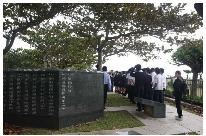
平和祈念公園「平和の礎」