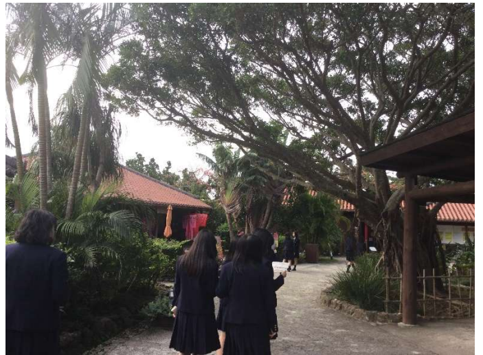
おきなわワールド