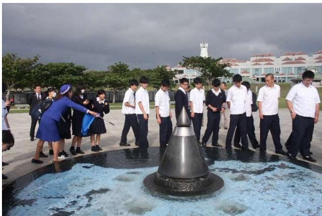
平和祈念公園「平和の広場」