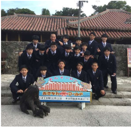
おきなわワールド