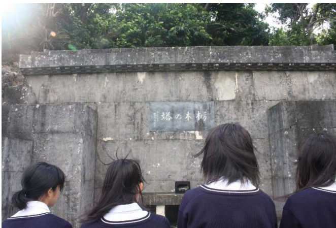
平和祈念公園「朽木の塔」