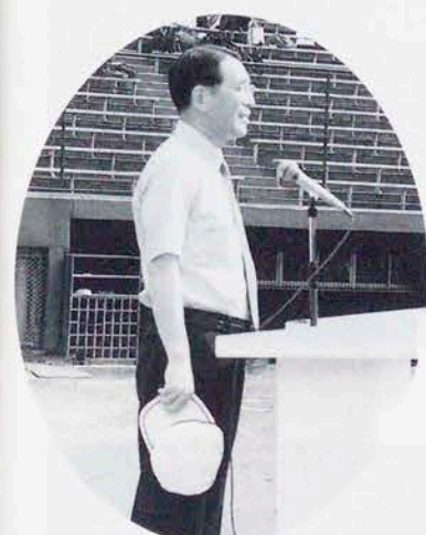
元気いっぱいにと校長先生の開会のことば