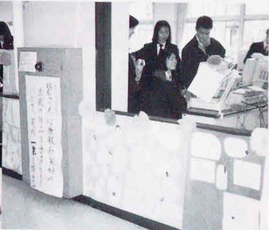
学校祭にワープロによる図形作品を展示(情報商業科)