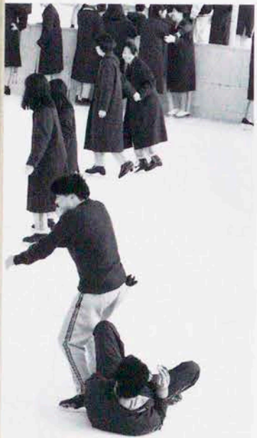
▶友情でもリンクではアブナイよー