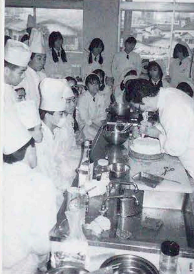
楽しいケーキ作り講習会(調理科)