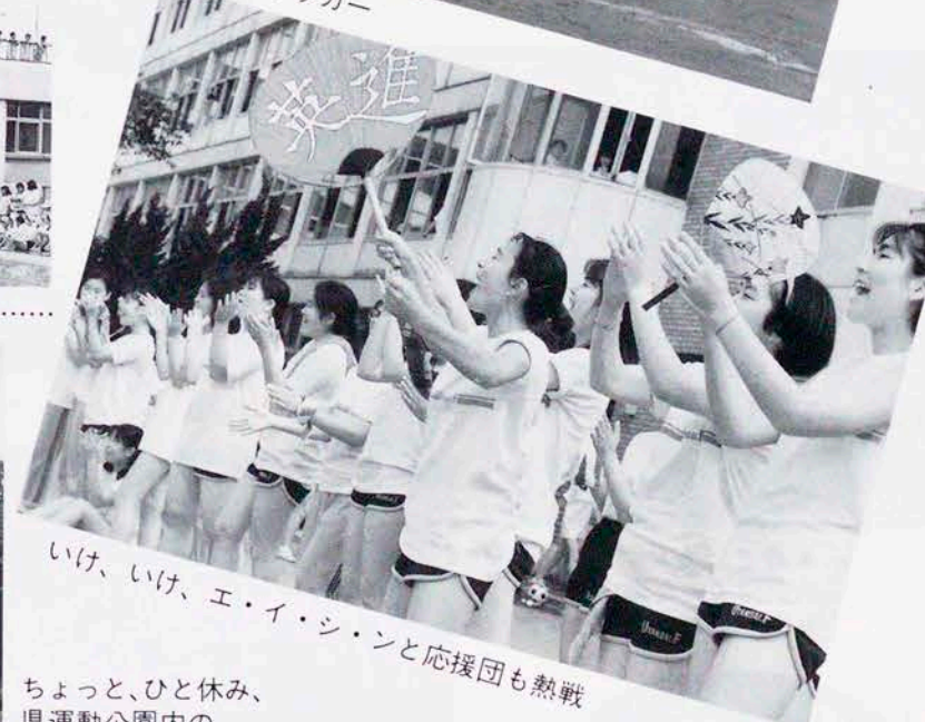
いけ、いけ、エイ・シンと応援団も熱戦