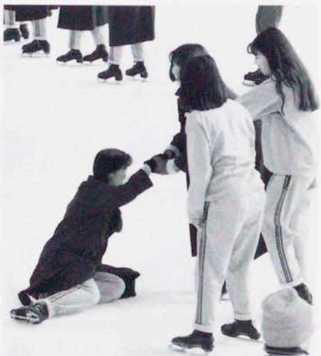
助けてー。3人でヨッコラショ。