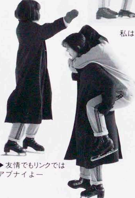
◀おっとごめん！あらー、いやだー！