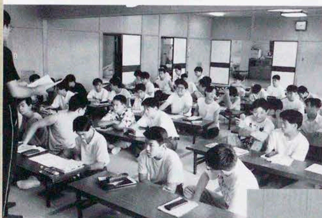
▲暑さにもめげず日光東照宮会館での合宿 ▶恒例の校内合唱コンクール