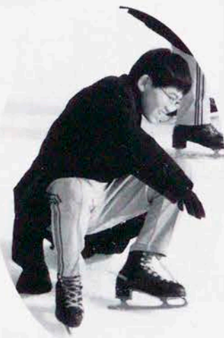
オットットツ、へへへ...