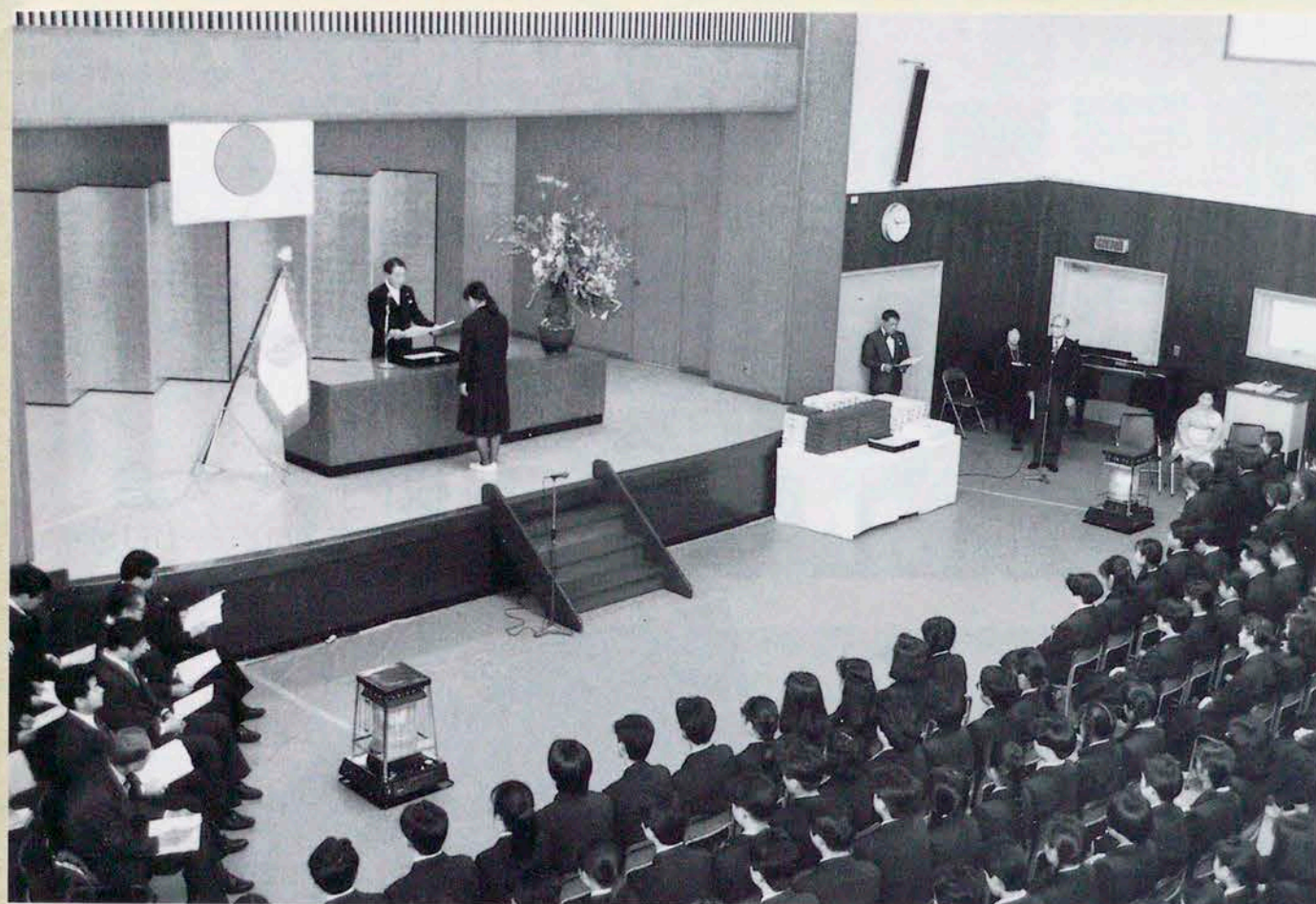
いま巣立ちゆく一晴れの卒業式