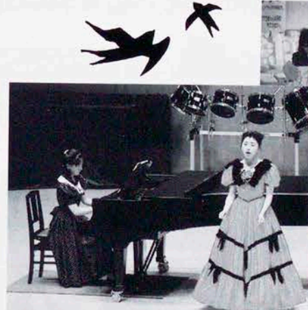
はなやかに卒業演奏会(音楽科)