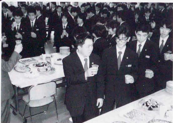
先輩の心づくしの品々で調理科の新入生歓迎会