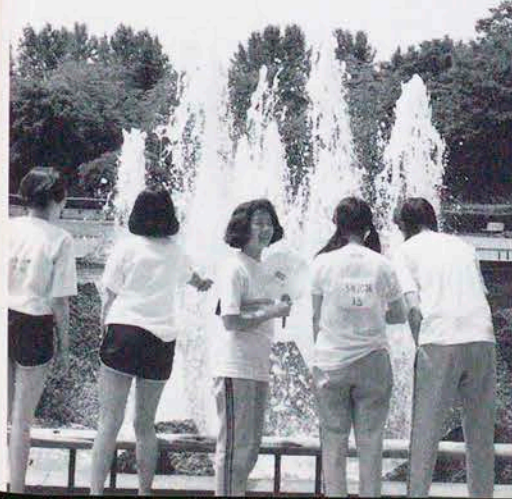
ちょっと、ひと休み、県運動公園内の噴水の前で