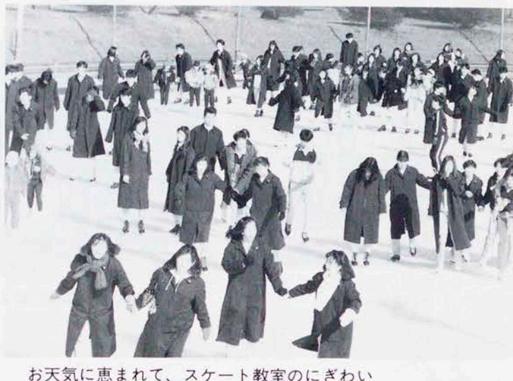
お天気に恵まれて、スケート教室のにぎわい