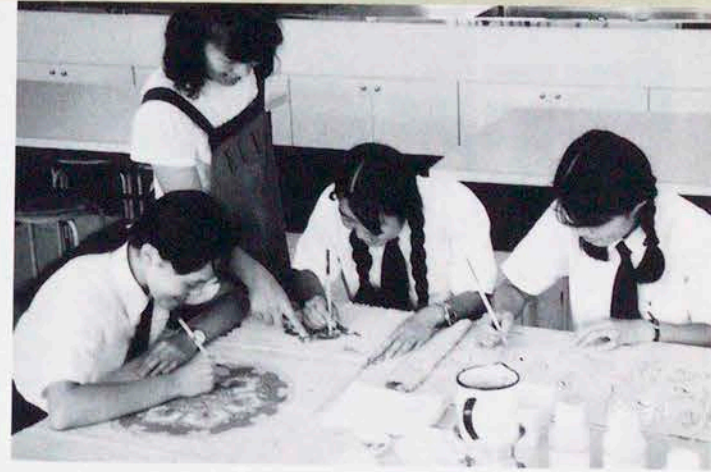
先生の指導でしほり染めに取り組む(生活教養科)