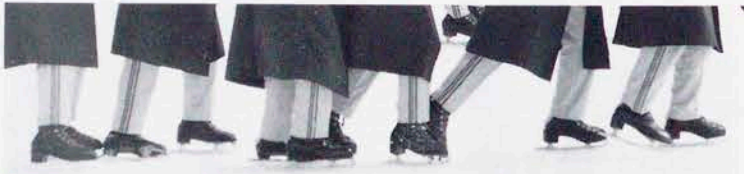
私はだれでしょう？みんなですべればこわくない