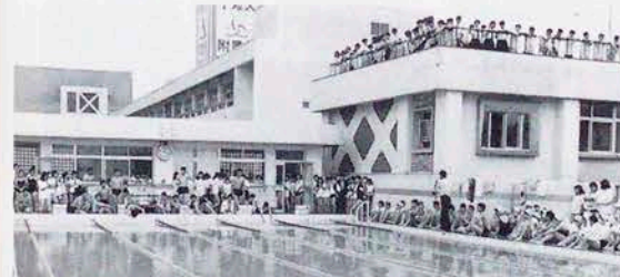
ご自慢の屋上プールで水しぶきを上げて……