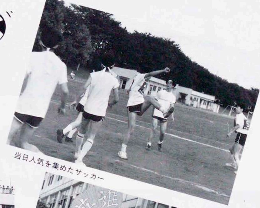
当日人気を集めたサッカー