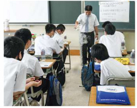
▲普通科模擬授業(理科の実験)