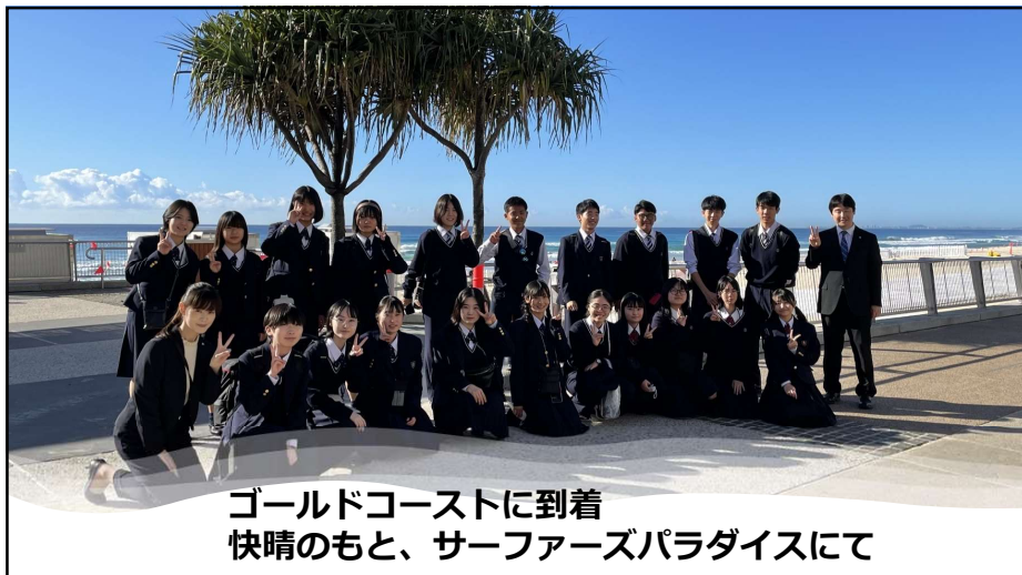
ゴールドコーストに到着 快晴のもと、サーファーズパラダイスにて