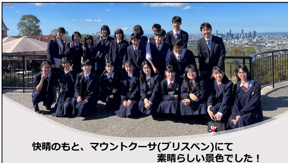
快晴のもと、マウントクーサ(ブリスベン)にて 素晴らしい景色でした！