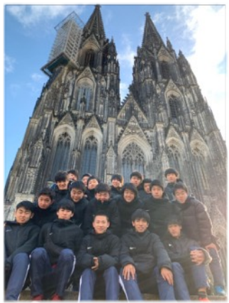
ユネスコ世界遺産ケルン大聖堂の前でそのスケールの大きさに圧倒された

サッカープログラムの間を縫って、ケルン、フランクフルトの文化財を見学しました。実際目で見ると、実物の迫力はまさに「百聞は一見に如かず」。皆、言葉を失いました。また世界最古の大学の一つであり、市民の手で築かれたケルン大学の施設見学をしました。日本同様、自ら学び続けることが尊いとされているドイツの価値観に触れ、これからの生活で学ぶ決意を新たにしました。