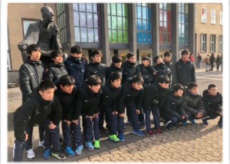
世界最古の大学の一つであるケルン大学（1388年創立）建学者「偉大なる者」マグヌスの像前で学ぶ決意を新たにしました