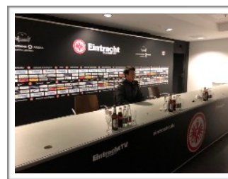
フランクフルトスタジアム記者会見場にて（長谷部選手を体感）