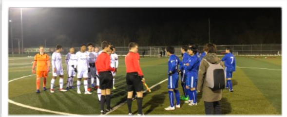
国際親善試合 対バイヤーレバークーゼン

ヨーロッパを代表する名門クラブであるバイヤーレバークーゼン、ドイツを代表するアイスバハタール、コブレンツとの3試合を実施しました。体格、技術力、判断力に勝る相手が、仲間と協力して、基本的に忠実にシンプルにプレーする姿勢から多くを学びました。