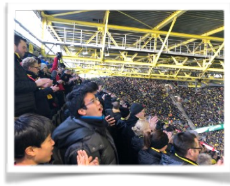
熱狂的で、クラブをこよなく愛するドルトムントのサポーターと共に