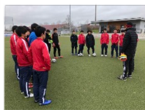
技術力、判断力を同時に磨く トレーニングに挑戦