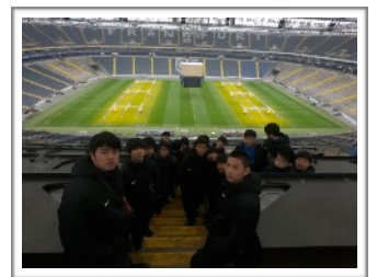
様々な仕掛けによるスタジアムでのサッカービジネスの仕組みを学ぶ