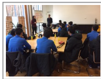
ドイツサッカーの歴史について講義（ドイツサッカー協会）

ドイツ金融の中心地であるフランクフルトにあるドイツサッカー協会を訪問し、ドイツサッカーの歴史についての講義を受け、またドイツ杯やワールドカップのレプリカなどに囲まれた展示を見学しました。「日本サッカーの父」と呼ばれるドイツ人コーチ デッドマークラマーさんのお話や、近年ドイツで活躍する日本人選手、逆に日本で活躍したドイツ人選手、2011年ドイツ女子ワールドカップでのなでしこジャパンの優勝など、ドイツと日本のサッカーのつながりについても再認識しました。また隣接するアイントラハト・フランクフルト（元日本代表キャプテン長谷部選手が所属）のスタジアムに伺い、ロッカールーム、ベンチ、ビジネスシート、記者会見場、記者席・観覧席などを見学しました。競技、サッカービジネス、サッカージャーナリズムといった複数の観点から、サッカーの社会的地位が高いドイツの最先端の状況を学びました。