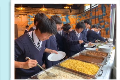
ビュッフェ形式でアスリートとしての食事の重要性を学んだ

この研修の実現をサポートいただいた関係者の皆様、保護者の皆様に感謝を申し上げます。このかけがえのない経験を糧に、感謝の気持ちを忘れず、更なる文武両道に邁進してまいります。