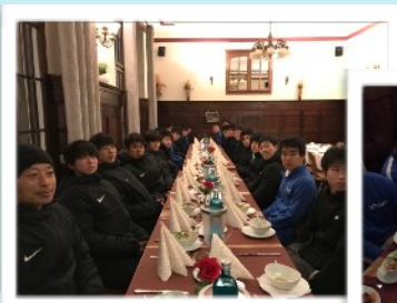
ドイツ伝統料理シュバイネハクツェ（豚のスネ肉）

旅の楽しみの一つである食事。雰囲気のあるレストランでドイツの伝統料理に舌鼓を打ちました。またドイツで活躍するサッカー選手が、アスリートとして、慣れ親しんだ和食とは違う海外の食生活に慣れていくことの大変さの一端を知ることができました。