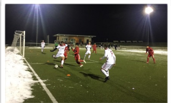
アイスバハタールU19との5対5のゲーム

ドイツFAライセンス保持者のコーチに指導を受け、試合の課題から導き出された、技術力、判断力を同時に伸ばすトレーニングに、頭も体もフル回転で取り組みました。最も声がかかった”Sauber spielen!”(スマートに正確にプレーする)ことの大切さを学びました。またゴールキーパー(GK)は、現地GKコーチから特別にトレーニングを受け、世界的に優秀なGKを数多く輩出するドイツゴールキーパーの基本を学びました。