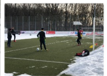
GK大国ドイツの真髄を学ぶ