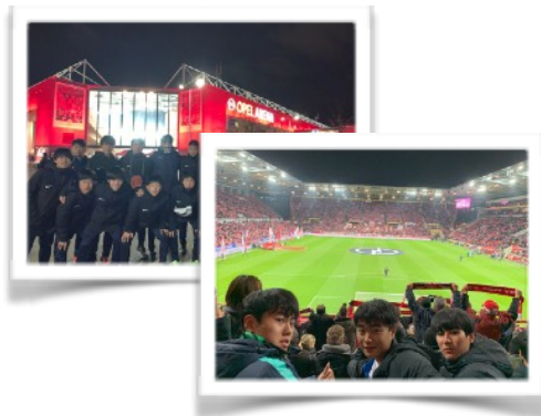
マインツスタジアム（オペルアリーナ）での試合観戦

マインツ対レバークーゼン（マインツ・オペルアリーナ, 3万人収容）、ドルトムント対 Hoffenheim（ドルトムント・シグナル・イドゥナ・パーク, 8万3,000人収容）のドイツ1部リーグ上位対決2試合をスタジアムで観戦しました。スタジアムの雰囲気圧倒されながらも、ピッチ上で繰り広げられるレベルの高い攻防を目の当たりにし、自らのサッカーを見直す絶好の機会となりました。また、試合後のごみの清掃の仕方など日本との違いについて参加者間で意見を交換しました。