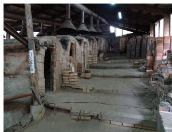
素晴らしいのほり窯