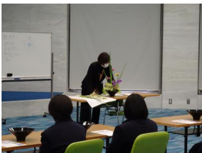
デモンストレーション