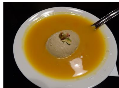
デザートのマングー