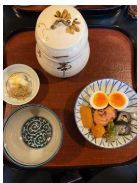
有名な瓢亭たまご