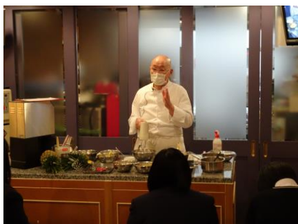
貴重なお話を聞けました