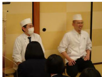
安納先輩から励まし をいただきました