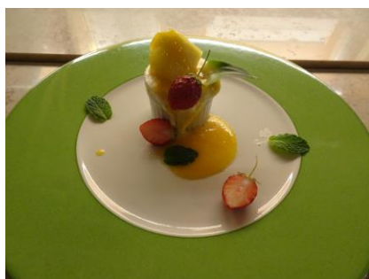
金蔵先生のスイーツを満喫しました