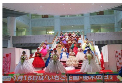
出演者全員でフィナーレ