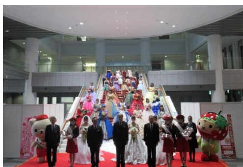
福田知事と出演者全員で記念撮影