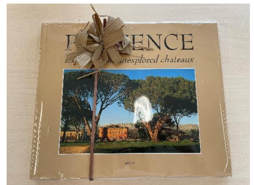
「プロヴァンスの写真集」

また「ヴォクリューズ県の皆様が、ふるさとを誇りに思い、ふるさとを自慢していること。今年が栃木県が誕生して150年の記念イベントが開催され、私たちも“ふるさととちぎ”を再発見して、とちぎを世界に発信していきたい」などお話しさせていただきました。