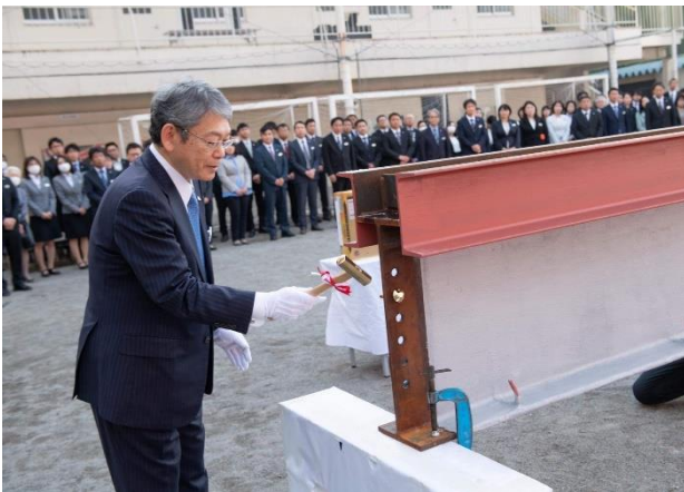
校長先生による「検鉦」