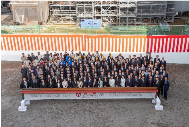
最上階の鉄骨を前に記念写真撮影

本校生徒も着々と進む建設現場を横目に授業を受けており、建築設計など理工系を目指す生徒が増えることを期待しています。