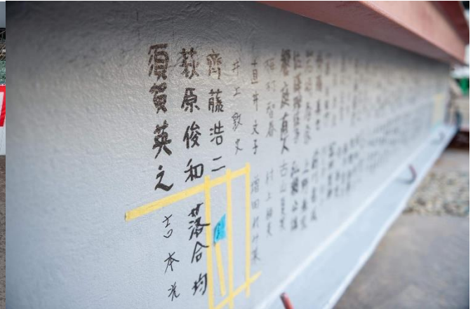
全職員と工事関係者がサイン