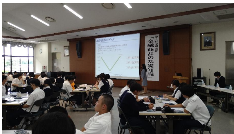
足利銀行の講師先生による全体説明