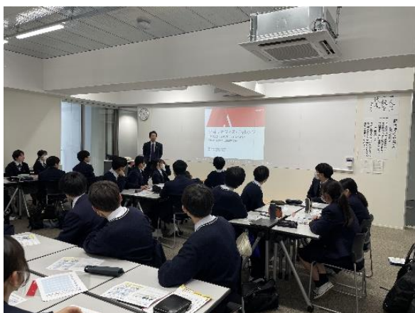
第2部 起業ワークショップの様子(1～3組)