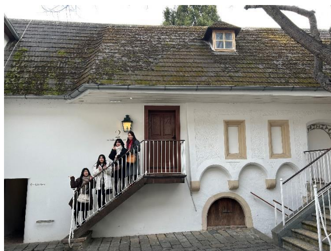
↑ ベートーヴェン博物館 (ハイリゲンシュタット)