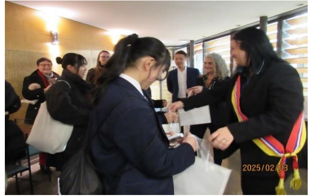
生徒達にもお土産をいただきました。