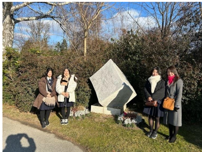
↑ 中央墓地公園（シェーンベルクのお墓）