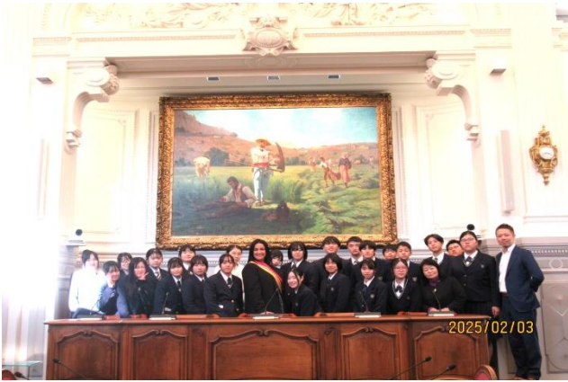
議長席・副議長席にて記念撮影