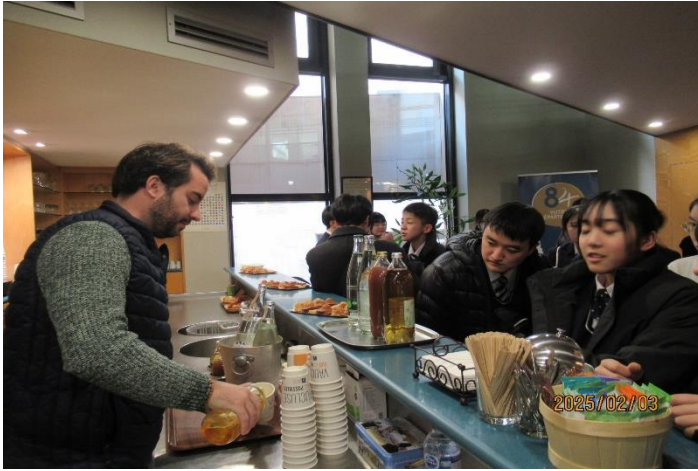
県議会の皆様とお茶とお菓子で交流会