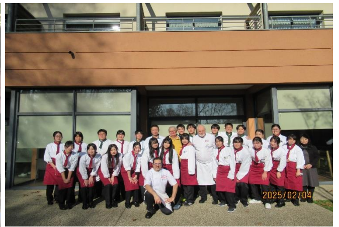
アヴィニヨン・ホテル学校では、2日間、プロヴァンス料理講習会