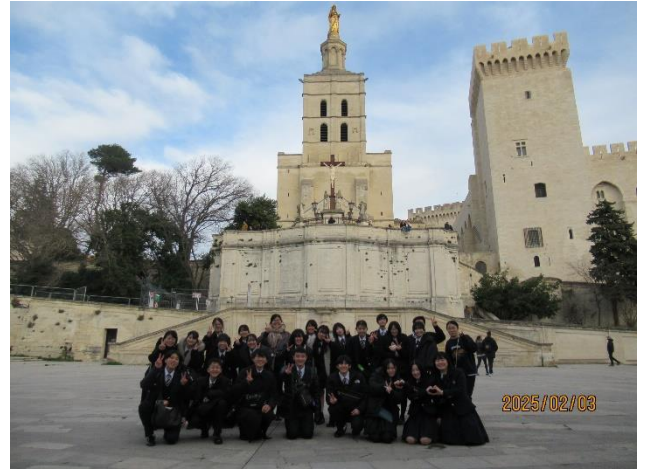
世界遺産「法王庁」見学