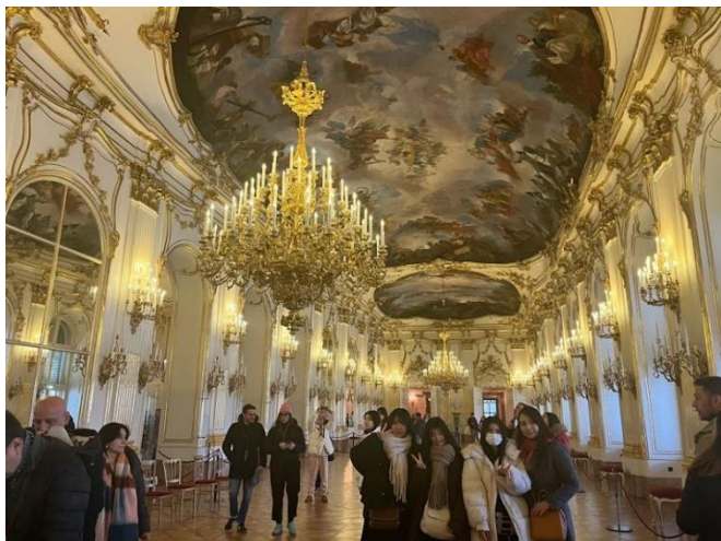
↑ シェーンブルン宮殿