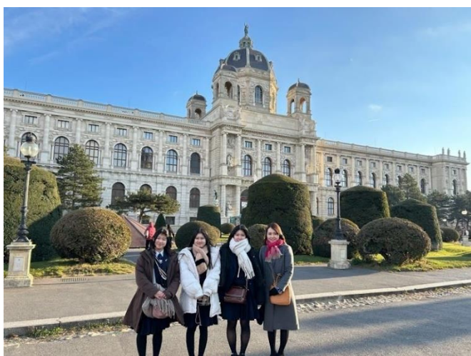
↑ ウィーン市内見学（美術史美術館）